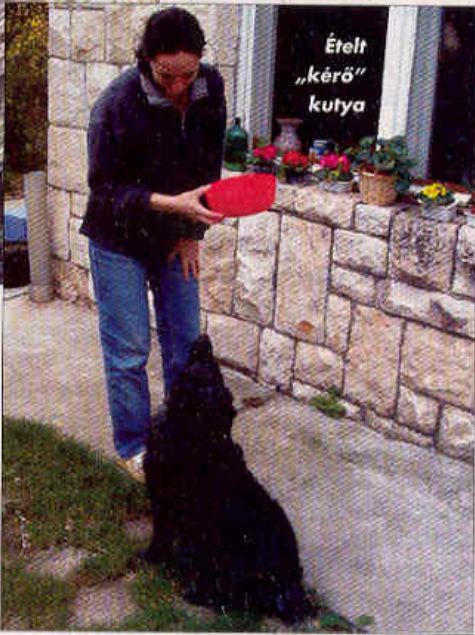
Érett „kérő” kutya