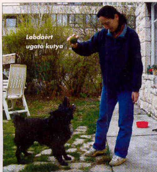
Labdáért ugató kutya

nem szereztek vizuális tapasztalatokat a kutyákról: tehát még sosem láttak kutyát. Ilyen embert, persze, csak a születésüktől fogva nem látók között találunk. Az ő tesztben nyújtott teljesítményüket összehasonlítottuk az életük során látásukat veszített és látó társaikkal. Kiderült, hogy ugyanannyi hangot kategorizáltak helyes kontextusban, mint a másik két csoport tagjai, és a hangulati értékelésük is hasonló volt. Tehát az ember számára elegendő a vokális információ ahhoz, hogy képet tudjon alkotni a kutya hangulatáról és a felvételi helyzetről.