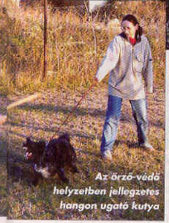
Az örzö-védő helyzetben jellegzetes hangon ugató kutya

Ez utóbbi kísérletben azt találtuk, hogy az alanyok vélekedése szerint az agresszív kutyák gyors ritmusban, mélyen és érdesen, a félelemmel telték és a kétségbeesettek magasan és csengőn, a játékosak és a vidámak pedig lassan és magasan ugatnak. A szituációkategorizálás eredményei szerint a mély ugatásokat, főleg ha a